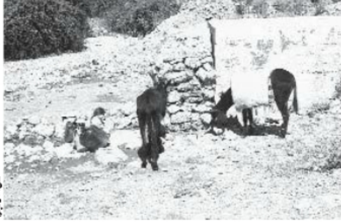
منبع يقصده الإنسان والحيوان على حد سواء

المطهرات لأسباب مجهولة. فيما تدفع الحاجة الملحة لبعض الآخر من السكان ملء دلائهم من المنبع رغم علمهم بالخطر