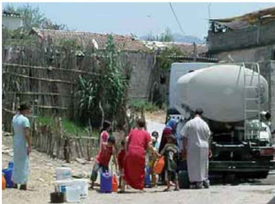
Les habitants se débrouillent comme ils peuvent

Certains affirment que l'eau a coulé, subitement, une seule fois. «Lorsque nous sommes allés nous plaindre auprès du chef de daïra, le lendemain on a vu l'eau venir, puis plus rien, c'est le retour à la misère quotidienne», se lamentent-ils. Ils soutiennent que l'agent chargé d'ouvrir les vannes, est en partie responsable de cette situation pénible, alors que d'autres voix dénoncent l'incapacité du service concerné à remédier à cette catastrophe. A l'ADE on accuse plutôt des inconnus d'avoir obstrué les vannes, s'avouant incapables