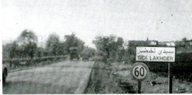
مدخل سيدي لخضر

قبو العمارة، مثلما جاء في نص عريضة لهم موجهة لمسؤول الهيئة التنفيذية الأول بالولاية تحصلت "الخبر" على نسخة منها، بكميات هائلة من المياه القذرة، بعد أن تعرضت القنوات النازلة للتطهير الصحي للتخريب الكلي. وأبدى السكان، حسب أقوالهم، استعدادهم للقيام بإصلاح قنوات الصرف الصحي وتهيئة القبو على