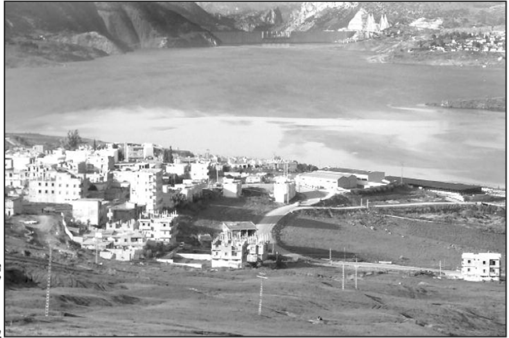
مياه السد تشكل خطرا على السكنات

وفي رده على هذه الاتهامات، نفى رئيس البلدية ضلوعه في توزيع قطع أرضية لأن هذه المهمة ليست من صلاحياته، موضحا أن توزيع السكنات من صلاحيات لجنة الدائرة التي تعكف هذه الأيام على دراسة الملفات، أما بخصوص المشروع الخاص بترحيل حوالي 600 عائلة، إضافة إلى مرافق أخرى تربية واجتماعية وشبانية فهولا يزال على مستوى وزارة الموارد المائية، في حين تبقى السلطات المحلية في حالة انتظار منذ سنوات.