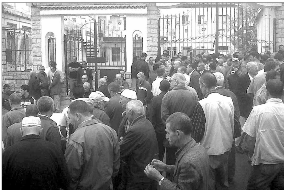
Les habitants réclament l'accélération des travaux de raccordement au gaz naturel.

Pour des raisons multiples, les habitants des villages d'Ath Wizgan et d'Ighil Tizi Boa, à l'est de Tizi Ouzou, ont procédé, avant-hier, à la fermeture des services publics de l'APC, de la daïra, de Sonelgaz et de l'Algérienne des eaux (ADE).