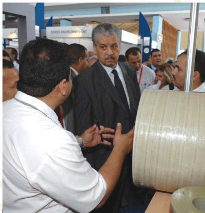
■ M. Sellal promet une meilleure gestion de l'eau.

à 50% alors qu'aujourd'hui la moyenne nationale oscille entre 25% et 30%», a fait remarquer M. Sellal. Soulignant que le taux de remplissage des barrages a atteint 68% contre 45% les années précédentes, le ministre a indiqué qu'en matière d'assainissement, plus de 170 stations d'épuration et de traitement de l'eau ont été réalisées depuis l'année 2000. Il a rappelé que l'Algérie compte actuellement 71 barrages et 14 barrages en cours de réalisation dont la plupart doivent être terminés fin 2013. Interrogé sur les coupures d'eau enregistrées durant les deux derniers mois à travers plusieurs wilayas du pays, le ministre a estimé qu'elles sont liées aux coupures d'énergie qui influent négativement sur la distribution. Sur le manque d'eau minérale sur le marché après l'Aïd El-Fitr, M. Sellal a expliqué que ce problème «est dû à la forte demande durant le mois de Ramadhan qui coïncide avec les vacances d'été». Il a souligné, à cet effet, que 45 autorisations ont été données à des opérateurs pour la production d'eau minérale, et dont 38 sont déjà opérationnels. Une commission ministérielle devrait se réunir prochainement pour étudier 20 autres dossiers d'investis-