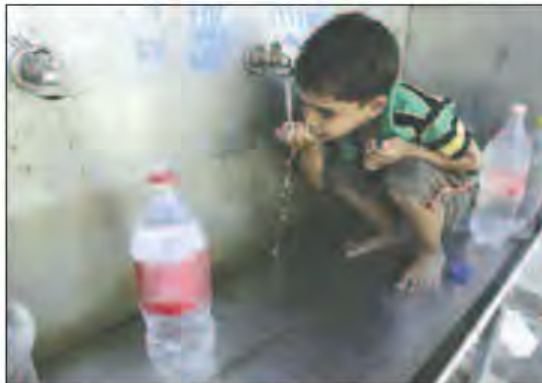
La préservation de l'eau, la nouvelle bataille de l'Algérie.

de la gestion de l'eau et la préservation des infrastructures du secteur ». D'ailleurs, lors de son intervention devant les cadres de son département, le premier responsable du secteur a tracé les contours de la future feuille de route du secteur en déclarant notamment que «la gestion et la préservation de l'eau sont désormais la nouvelle bataille de l'Algérie après celle de la mobilisation de la ressource, qui a coûté à l'Etat plus de 50 milliards de dollars». Selon lui, «Nous avons gagné la bataille de la mobilisation (de l'eau) et nous devons entamer la